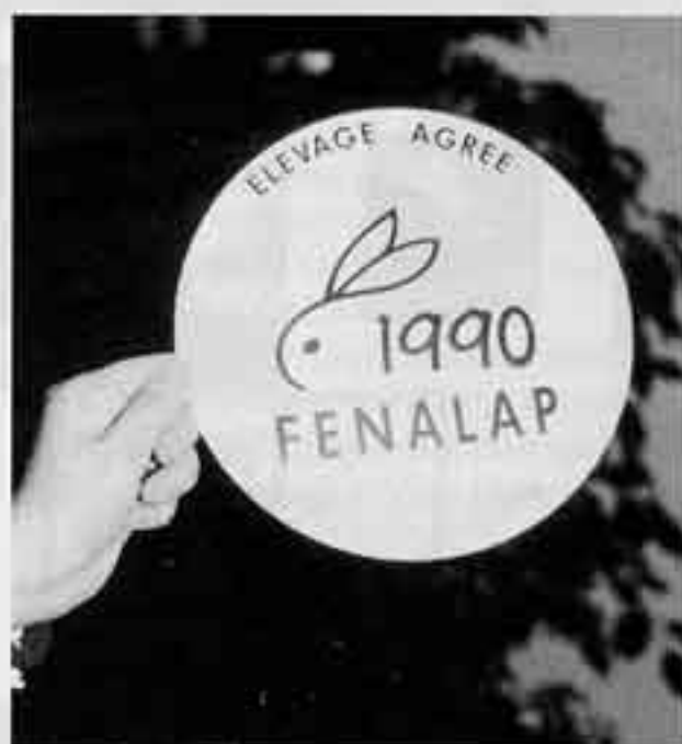
Ce petit panneau a fait son apparition à l'occasion du Simavip. Il sera apposé sur les portes des élevages de sélection et de multiplication agréés par la Charte Fenalap.