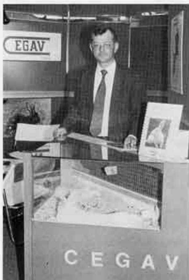
Le Cegav montre ses reproducteurs. Un "nid" avait été aménagé avec une femelle et sa portée.