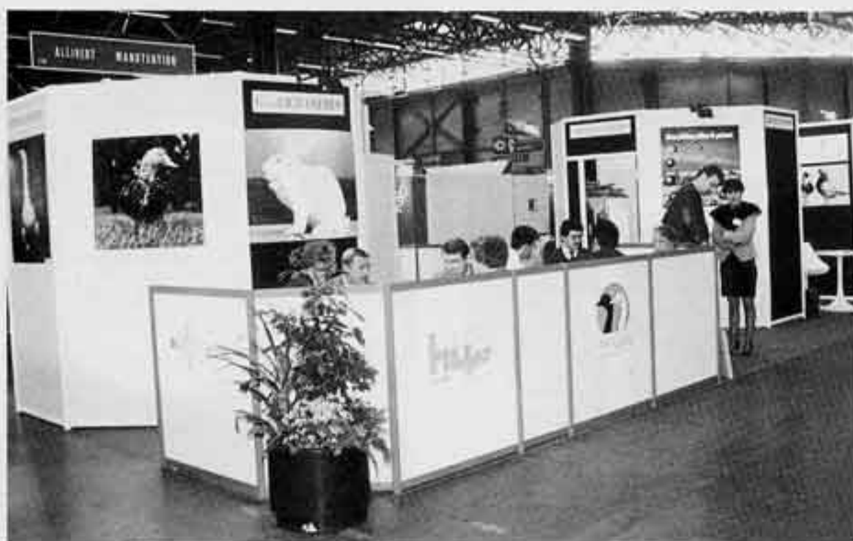
Chez Grimaud, les lapereaux d'1 jour représentent 40% de la production de GP. Mais d'autres techniques sont à l'étude actuellement.

L'insémination artificielle pourrait être un moyen adéquat de mener cette conduite en bandes intégrales, qui diminuant le temps de travail (tout le cheptel est inséminé en une fois) permettrait