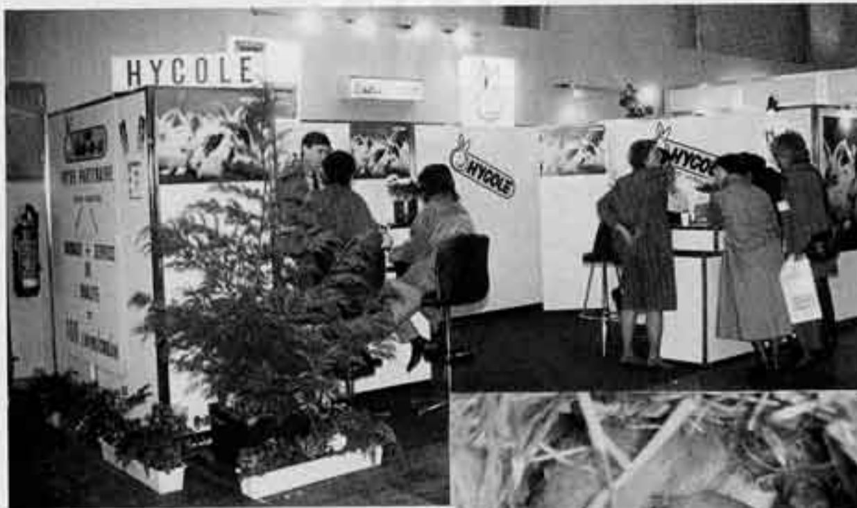
Sur le stand du GAEC Cuni-Co-Le, des lapereaux d'1 jour en chair et en os étaient présentés aux visiteurs.