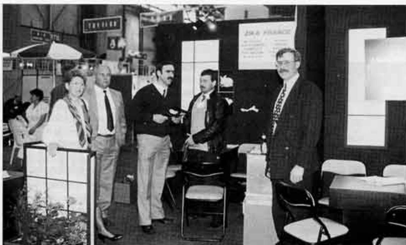
La souche lourde Zika intensifie son implantation dans l'Ouest de la France.