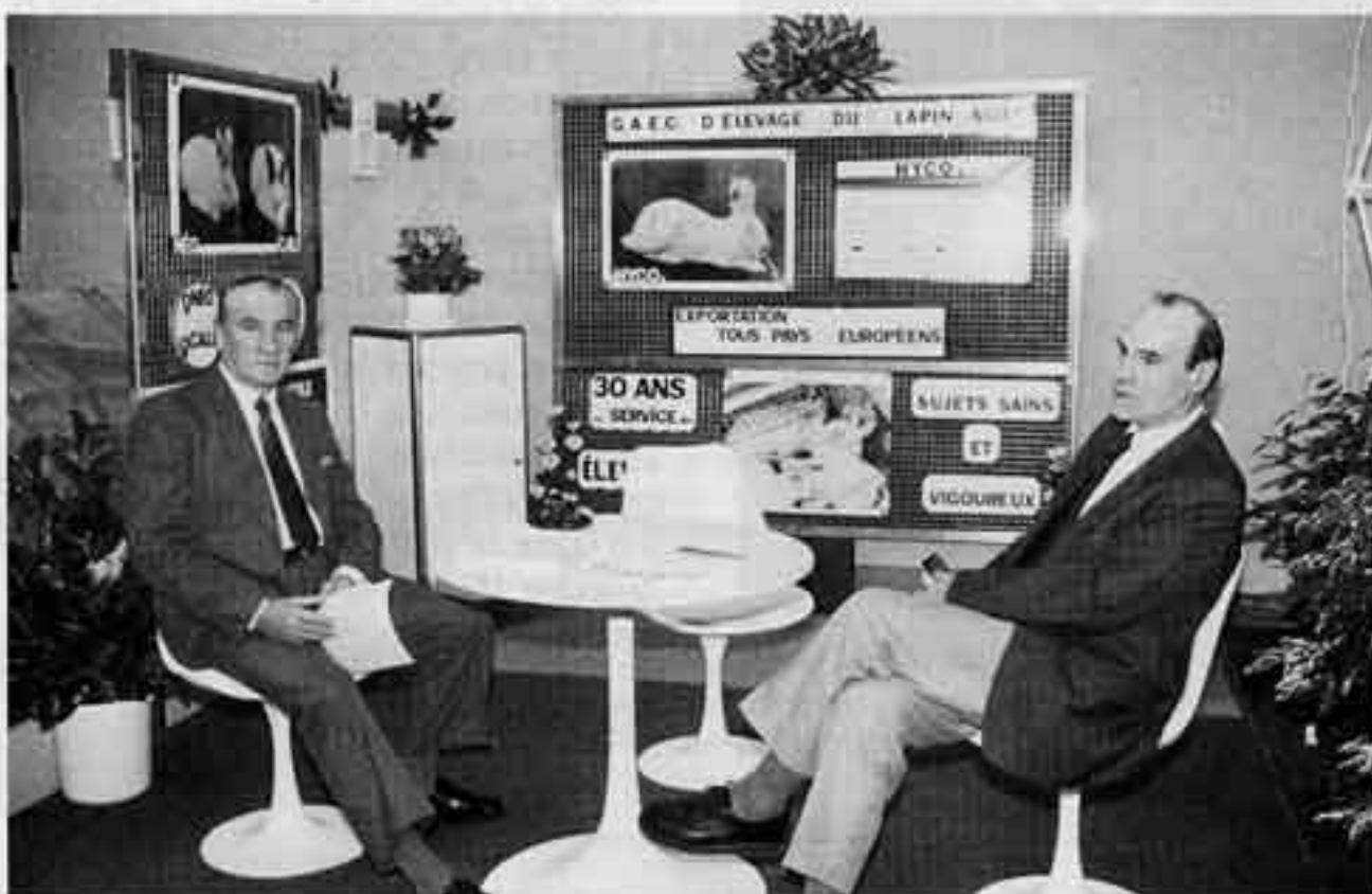
Les responsables du Gaec du lapin Agile se sont montrés plutôt satisfaits de ce 7e Simavip, tant au niveau de la diffusion des hybrides que des races pures.