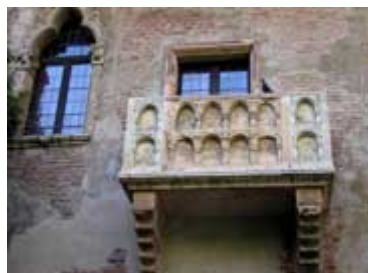
La maison de Juliette à Vérone et le balcon sous lequel soupirait Roméo (selon Shakespeare)

Le Congrès est aussi l'occasion pour tous les