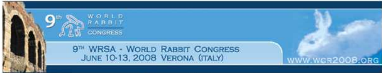
9th Congress (2 présentations)